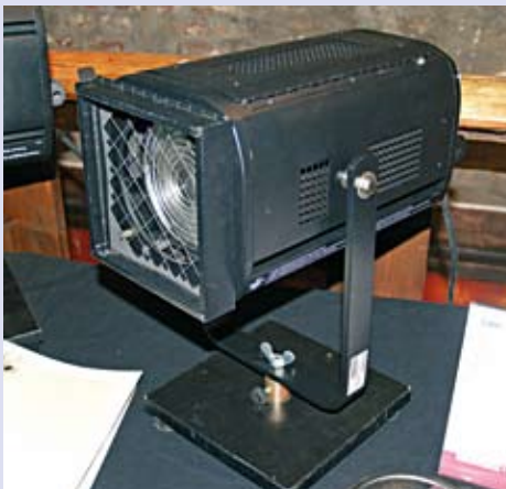
LUTIN von Robert Juliat