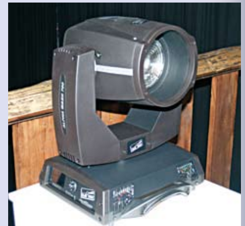
Der ALPHA Wash 700 von Clay Paky