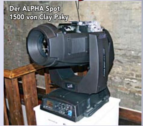
Der ALPHA Spot 1500 von Clay Paky