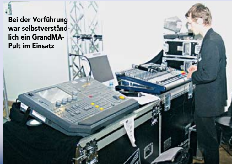
Bei der Vorführung war selbstverständlich ein GrandMA-Pult im Einsatz