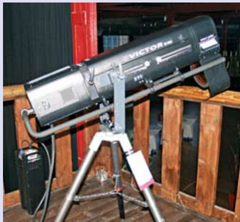
Der Verfolger „Victor“ für große Distanzen von Robert Juliat