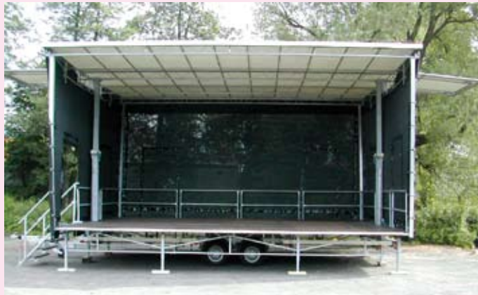
Die FreeSTAGE Medium beim Aufbau und spielfertig

Unternehmenskonzeptes. Ob es um Wartung, Reparatur oder Transport von den Produkten von Stagepartner geht – das geschulte und fachkundige Personal steht immer hilfreich zur Verfügung. Das große Interesse der Gäste an den Produkten der Fa. STAGEPARTNER zeigte wieder einmal, dass innovatives Denken und kundenorientiertes Handeln für den Erfolg eines Unternehmens ausschlaggebend sind.