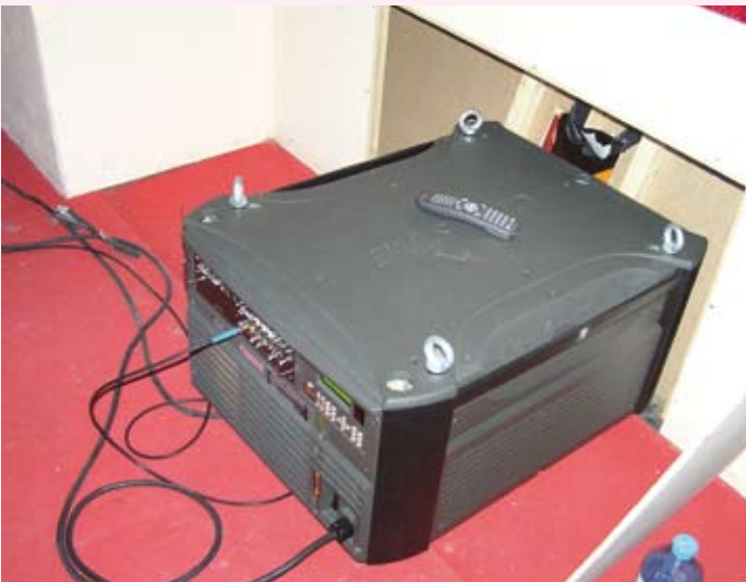
CHRISTIE-Drei-Chip DLP-Projektor mit Xenonlampe, 12 kW, neueste Generation der DLP-Projektionstechnik