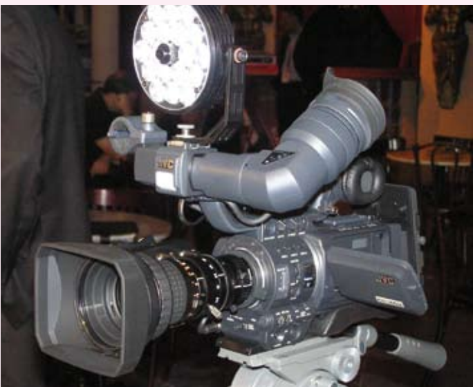
LED-Kameraleuchte von LDDE mit 18 LEDs à 1 W