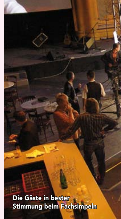
Die Gäste in bester Stimmung beim Fachsimpeln