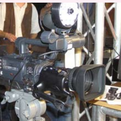
JVC HD Kamera GY HD 251 , für ENG und Studio vorgesehen, HDV und DV kompatibel