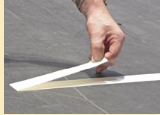
Richtig: Klebeband nach hinten abziehen

Ein Jahr verging von der Idee bis zum fertigen Produkt, über ein halbes Jahr wurde an der Umsetzung gearbeitet. Dafür arbeitete die Bühnenbau Wertheim sowohl mit einem Hersteller von Bühnenbodenfarben als auch mit einem Hersteller von Klebebändern zusammen, unternahm Versuche und Tests, bis das geeignete Band gefunden werden konnte. Dieses ist auf die Böden der Bühnenbau Wertheim abgestimmt, aber auch