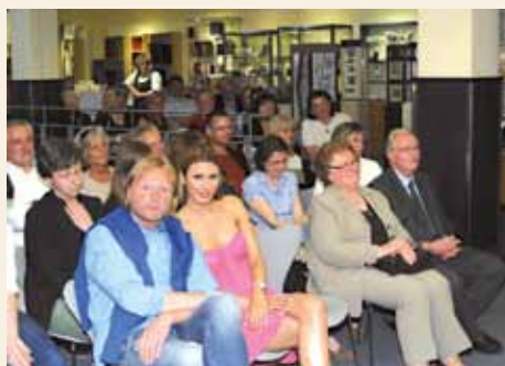
Ganz rechts die stolzen Eltern des Bühnenbildners