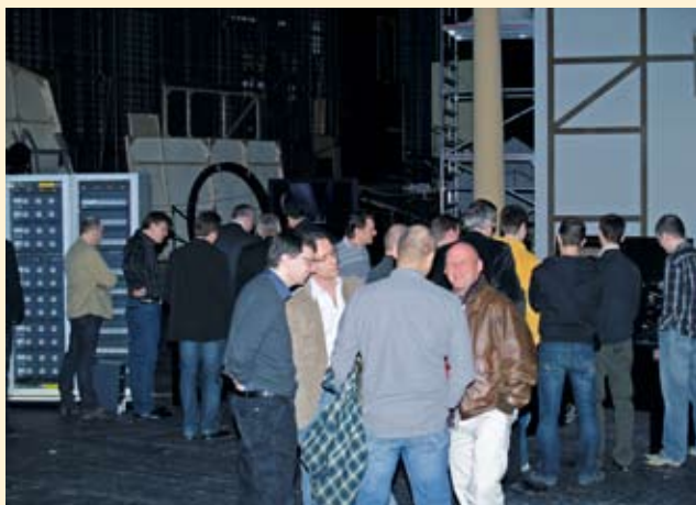
Viel Prominenz aus der Theater- und Eventszene traf sich auf der Bühne der Burg

designern und Programmierern aus den Bereichen Oper, Theater, Musical, Concert-Touring, TV und Film wurden komplett neue Hardware-Lösungen entwickelt, die auf der renommierten grandMA-Software aufbauen und diese intelligent weiterführen. Sie bieten mit optimierten Bildschirm-Layouts die gleiche Bedienweise sowie Kompatibilität mit der grandMA „Serie 1“ und bilden speziell für