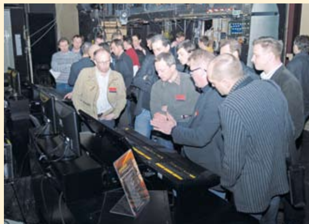
Das große Interesse der Fachleute steht ihnen ins Gesicht geschrieben