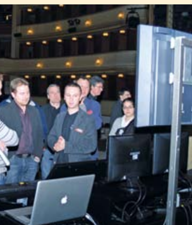
sichtlich beeindruckte Teilnehmer