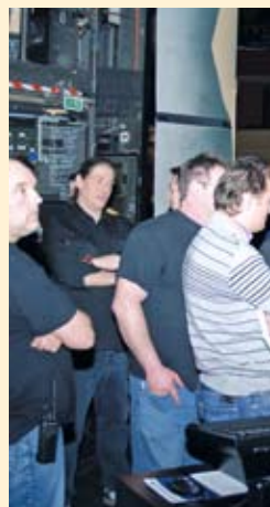
Vom grandMA full-size