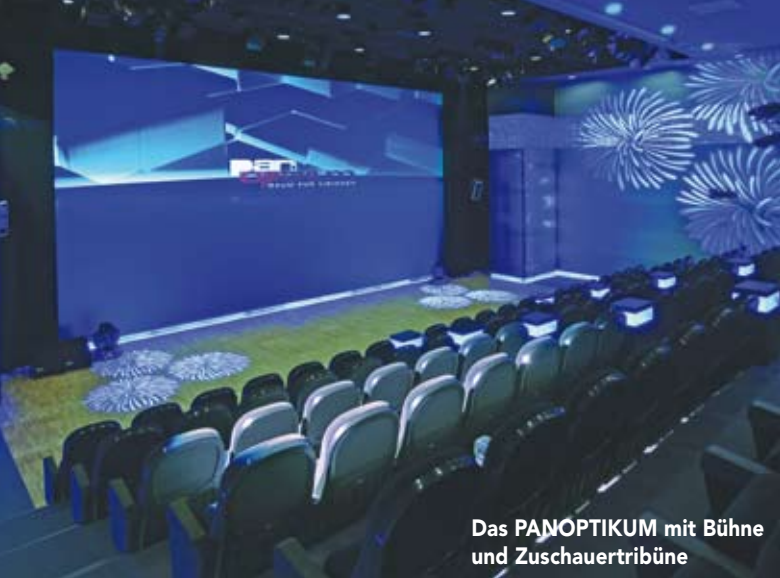
Das PANOPTIKUM mit Bühne und Zuschauertribüne