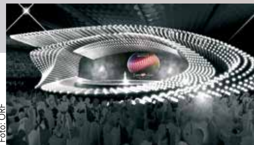
Eurovision Song Contest 2015 in Wien