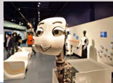
Roboter Mertz im Ars Electronica Center